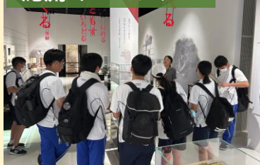
泥流ミュージアム