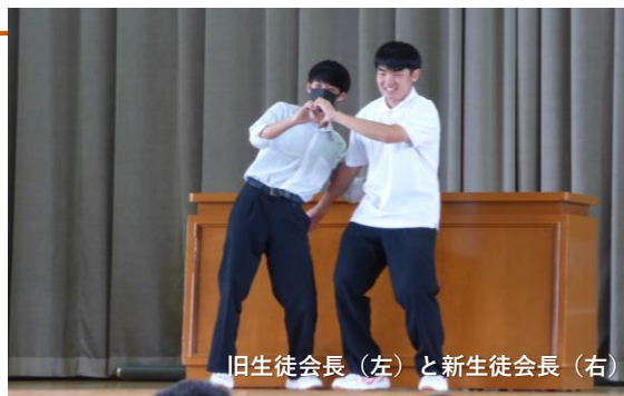
旧生徒会長（左）と新生徒会長（右）

9月2日（土）に生徒会認証式が行われ、3年生を中心とした生徒会役員の任期が終了し、新たな生徒会がスタートしました。旧生徒会役員は、1年間の活動を通して経験したことや感謝の言葉を述べ、新生徒会へのエールを送りました。その後、新生徒会役員から一人ひとり挨拶があり、新体制に向けての意気込みが語られました。