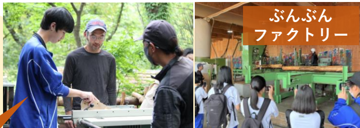
ぶんぶんファクトリー