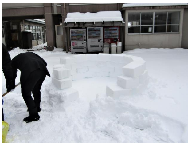
▲土台作り。ボックスに雪を入れて固めたものを積み上げる。