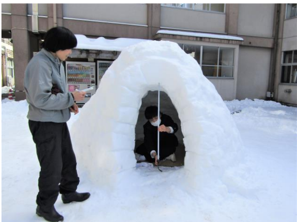
▲出来上がった『イグルー』を測定している様子。