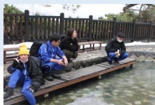
◀漫画堂と西の河原公園