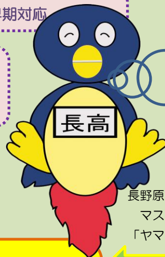
長野原高校の マスコット 「ヤマすけ」