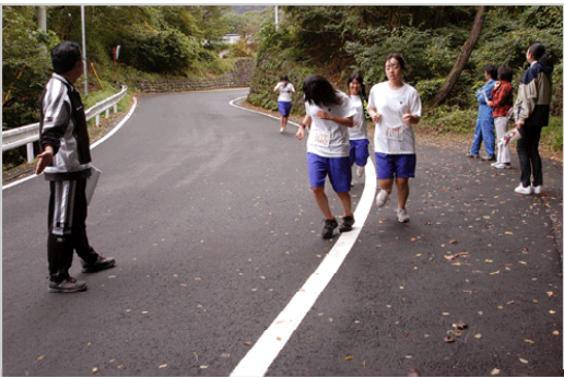
ゴールは、もうすぐ