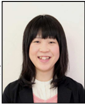
《1組担任 五十部 岬》

最後に、私自身をさまざまな場面で、サポートしていただいた保護者の方々や周囲の先生方には、大変お世話になりました。感謝申し上げます。また、卒業生の皆さんにも感謝したいと思います。「3年間ありがとう！」そして、「卒業おめでとう！」