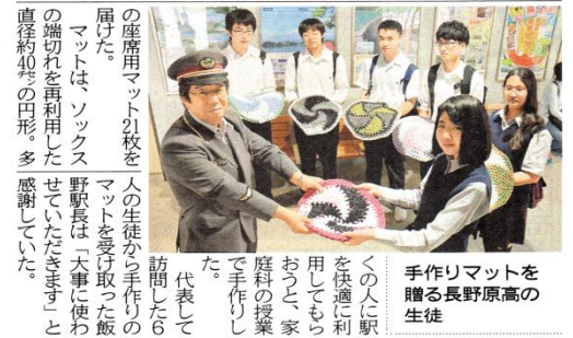
訪問した6人の生徒から手作りの座席用ソックマットを21枚、駅に贈る。代表して